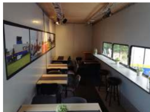
Interieur trailer 4

Ons rijdend materieel bestaat uit 2 opleggers, een schamelwagen en een gesloten aanhanger. Geschikt voor: concoursen hippique, voetbaltoernooien, hardloophwedstrijden, fairs, keuringen van zowel paarden als koeien. Ons materieel is reclame vrij.