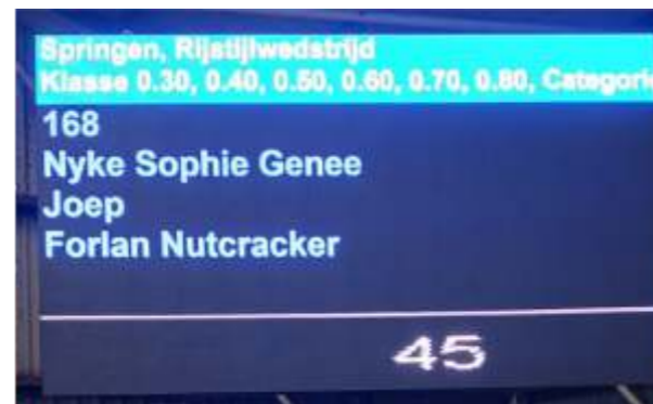
LED scherm met namen en tijd